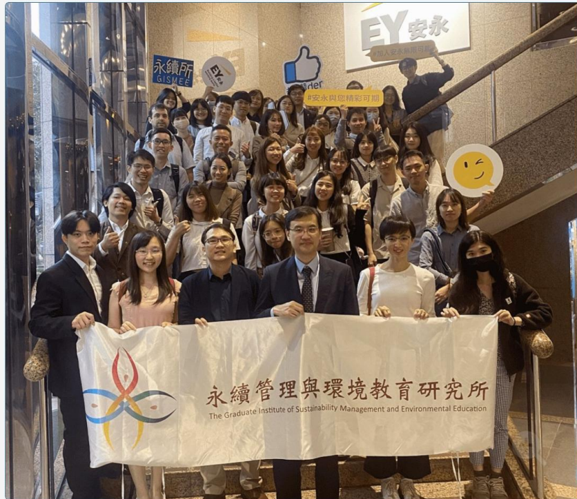
國立臺灣師範大學永續管理與環境教育研究所日前前往安永聯合會計師事務所，和安永氣候變遷與永續發展部門進行「共創永續未來」交流會。