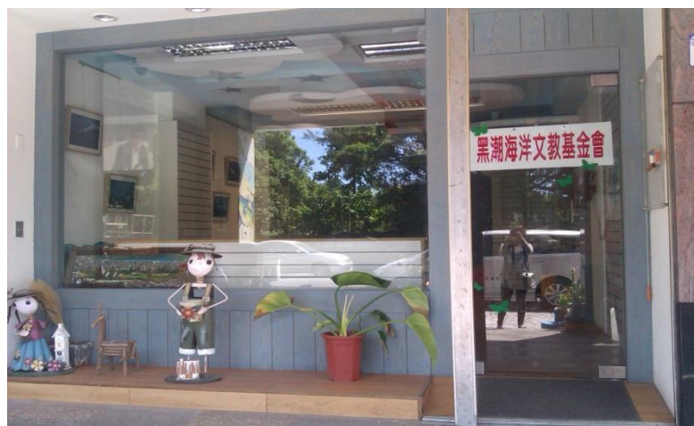
圖 1-2 黑潮海洋文教基金會實景照