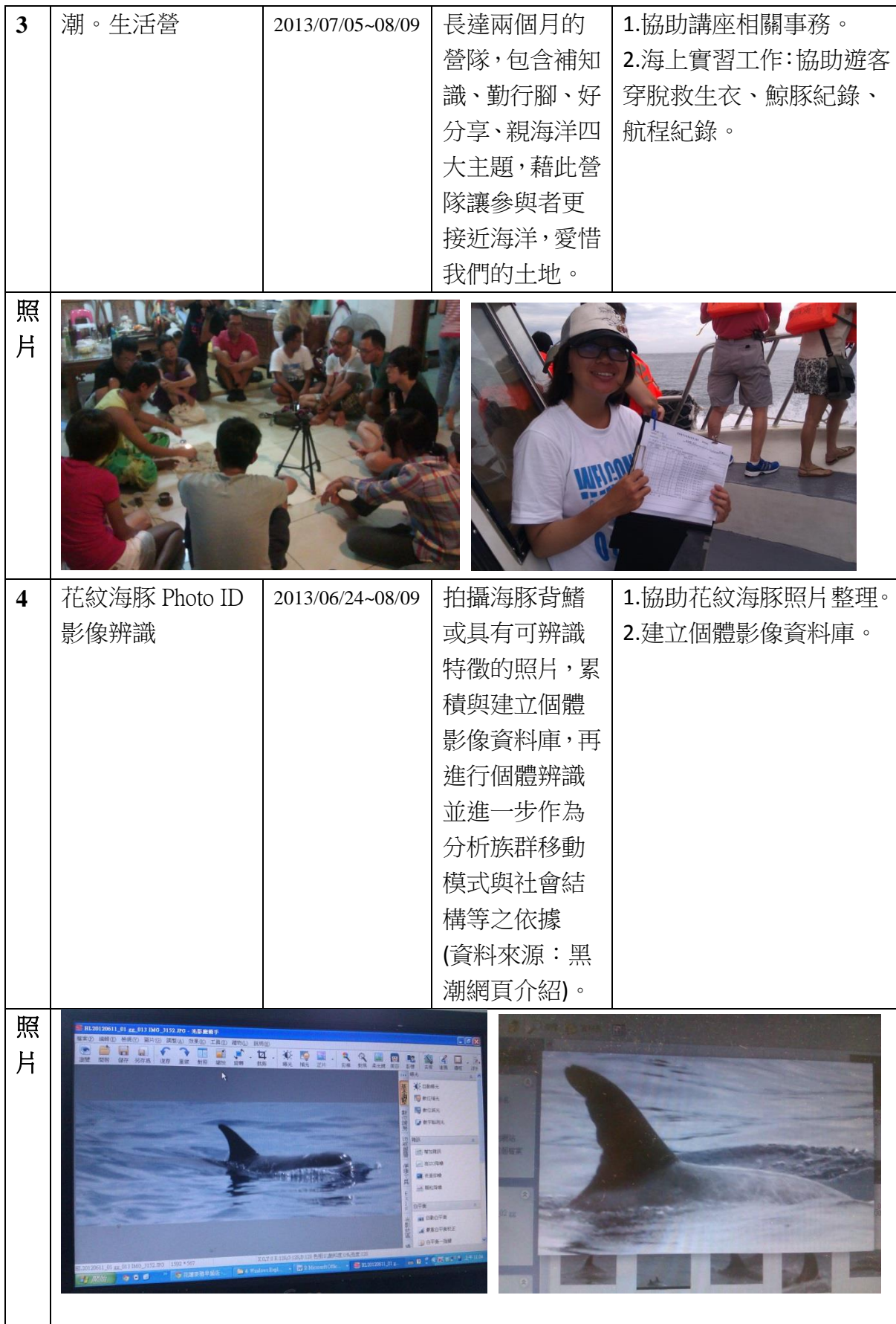
表 2-1 實習工作內容