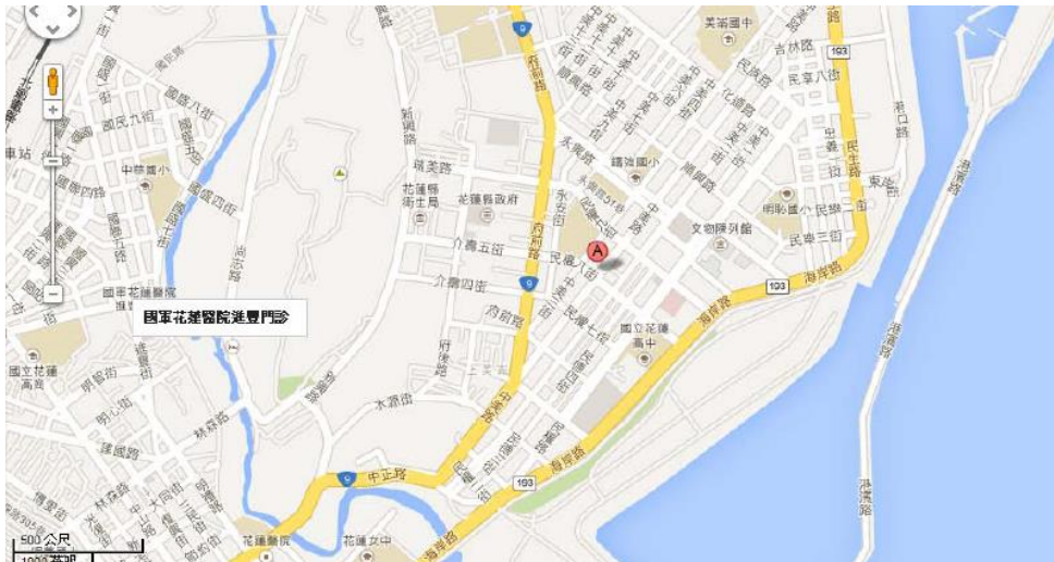
圖 1-1 黑潮海洋文教基金會現址

黑潮海洋文教基金會在 2013 年的暑假搬了新辦公室，從位於花蓮火車站後方的富陽路，辦到位於美崙區的中美路，如圖 1-1。